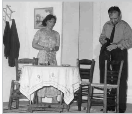
«Οι Φίλοι» του Κ. Μουρσελά (2001)

Η δουλειά της Ομάδας παρουσιάζεται τόσο σε αυτόνομες παραστάσεις-παραγωγές, όσο και μέσα από φεστιβάλ θεατρικών ομάδων Δήμων και Σωματείων. Αξίζει να αναφερθεί ότι η Ομάδα πάντα έπαιζε και «εκτός έδρας», δίνοντας παραστάσεις σε κωμοπόλεις και χωριά (Μελίκη, Θέρμη, Συκούριο, Όσσα, Βερτίσκοκ), έχοντας την