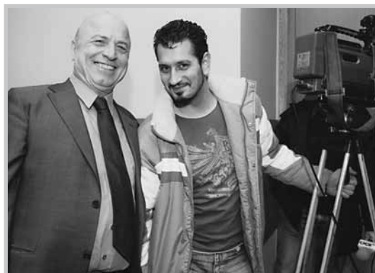
Ο φωτογράφος κ. Μιχάλης Παππούς και ο τεχνικός της ΕΡΤ που κάλυψαν την εκδήλωση του ΙΣΘ.