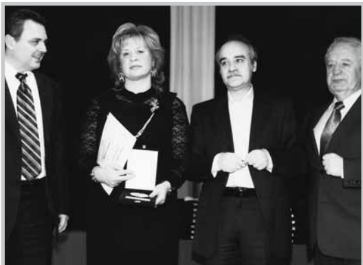
Ο βουλευτής κ. Θωμάς Ρομπόπουλος κατά την απονομή.