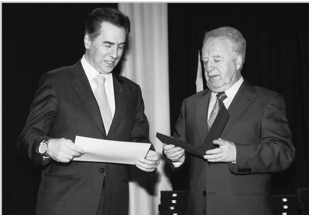
Ο δήμαρχος Θεσσαλονίκης κ. Βασίλης Παπαγεωργόπουλος με τον πρόεδρο του ΙΣΘ κ. Αθανάσιο Νικολαΐδη κατά την απονομή.