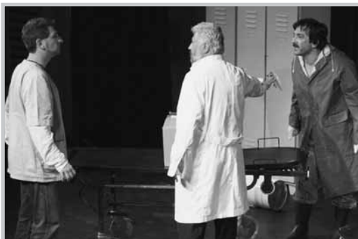
«Αξίριστα Πηγούνια» του Γιάννη Τσίρου (2009)

Η Θεατρική Ομάδα του νοσοκομείου μας γεννήθηκε το 1991, με πρωτοβουλία εργαζομένων του νοσοκομείου, υποστηριζόμενη από το Σωματείο Εργαζομένων, αλλά και μεμονωμένους