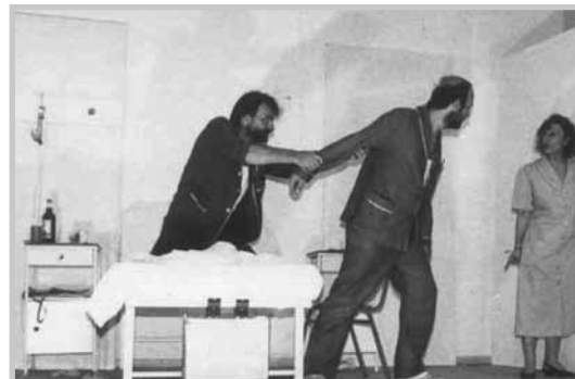
«Το Διπλό Κρεβάτι» του Μανόλη Κορρέ (1991)